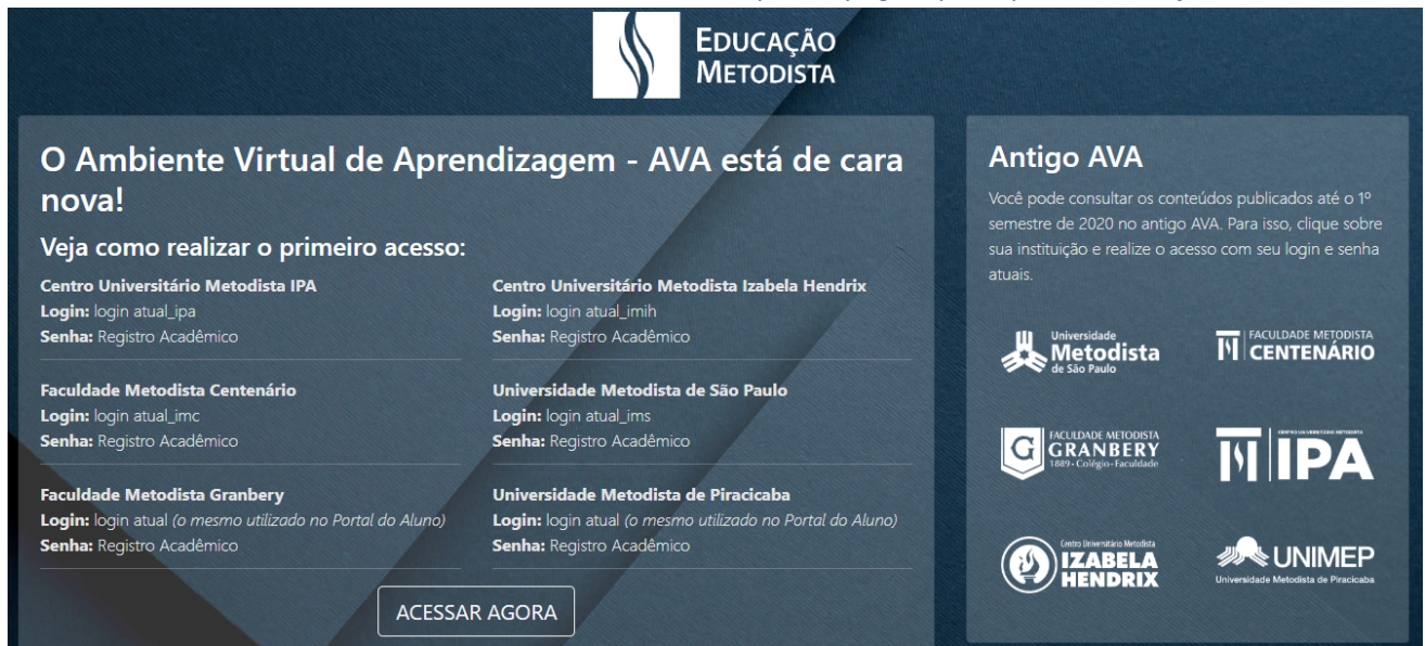
Figura 1: Página Educação Metodista

Ao Acessar o Novo Moodle você será direcionado para a página principal da Educação Metodista.